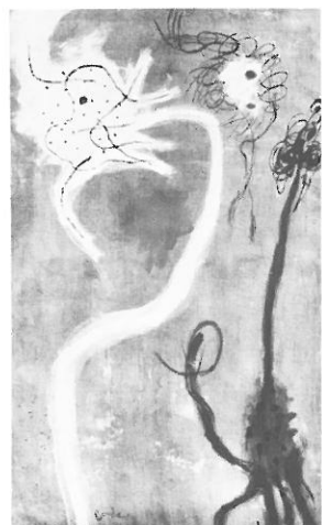
5 CONSTANT, Witte vogel , 1948, olieverf op doek, 140 x 65 cm, Collectie De Jong, Ascona