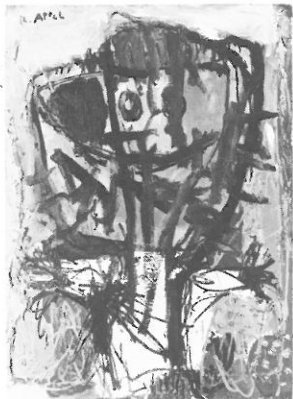
3 KAREL APPEL, Schrik in het gras , 1948, olieverf op doek, 95 x 71 cm, eigendom van de kunstenaar