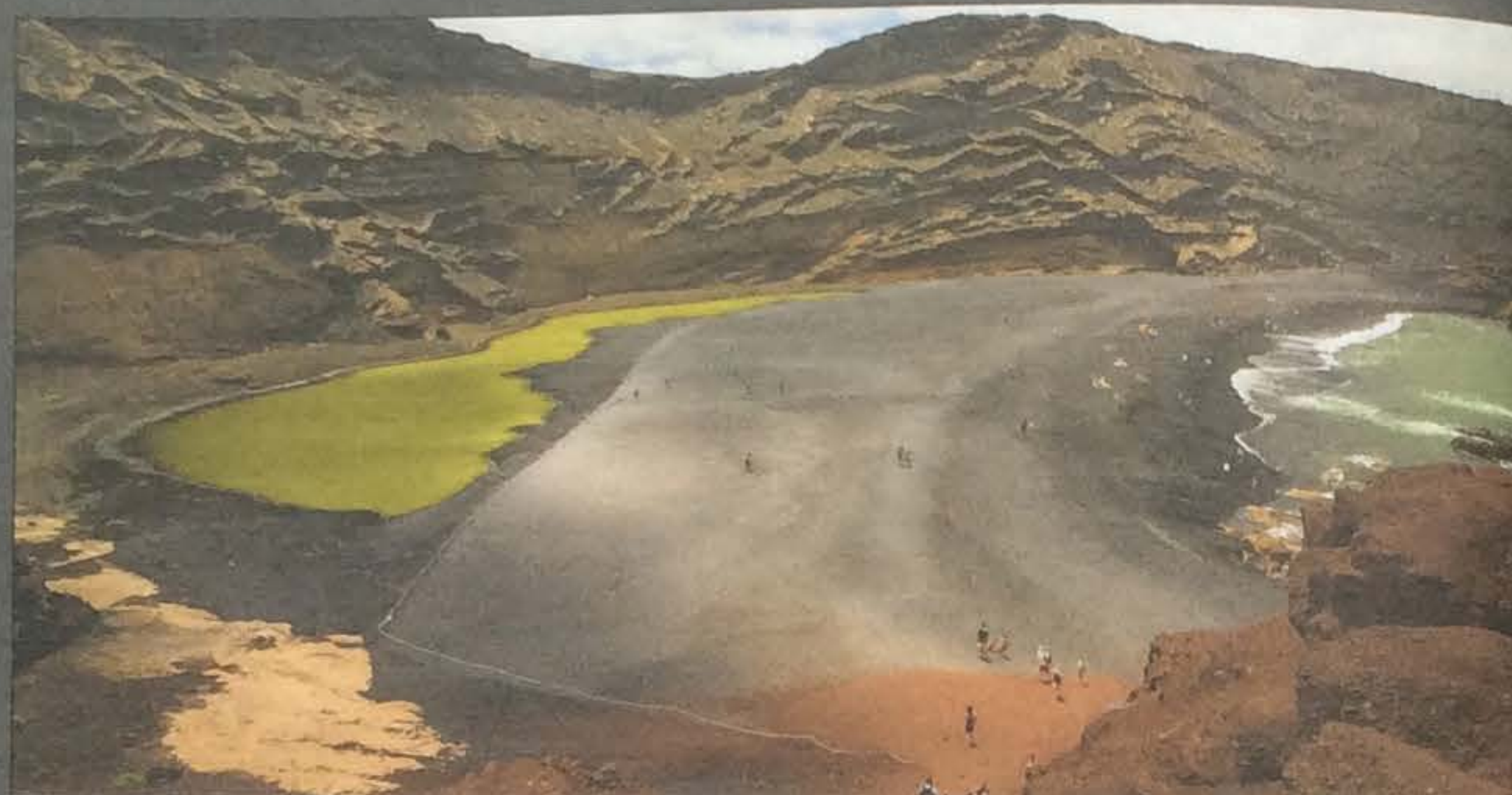
9 Landschap: Lanzarote 'Het is een vulkanisch eiland. De kleuren van het land zijn ongelooflijk: rood, bruin, groen, oranje.'

► faamde theesalons. De gesprekken gaan over wetenschappelijke ontdekkingen, over schilderen en vooral ook over Sigmund Freud, de psychoanalyse en de werking van het brein.