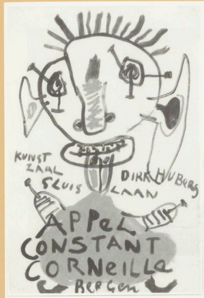
Eén van de affiches uit 1949. (Collectie G. Meulensteen) (Foto: Wouter Hubers)