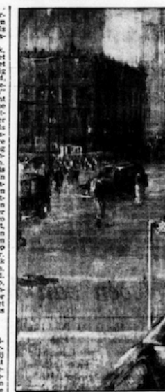
„Het nieuwe Moskou“ heet dit schilderij van de Russische schilder Jurij P. kapitalistisch beeld van de hoofdstad van de Sovj.

hij verdient, ook al zal dese retrospectieve die waardering nauwelijks te hand werke, doordat te vew van zijn late werk opgehangen is dat niet tot zijn beste behoort. Bijna der Indroverklend daaretoegen d' machtige expositie van Delezroux, die in de stad Venetië zelf te zien is, an de Piazza San Marco. Zij maakt de delik, hoewel de impressionisten na deze groote romantische te dank hebben, en geeft o.a. in een reel nooit tevoren geïmponeerde en te delidit uit Canada afkomstige werke een magistrale indruk van de mee ter.