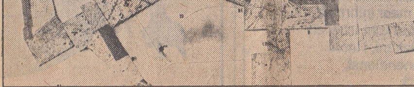
Symbolische voorstelling van New Babylon-Constant.

Constant doet twee dingen. Hij beschrijft theoretisch de voorwaarden