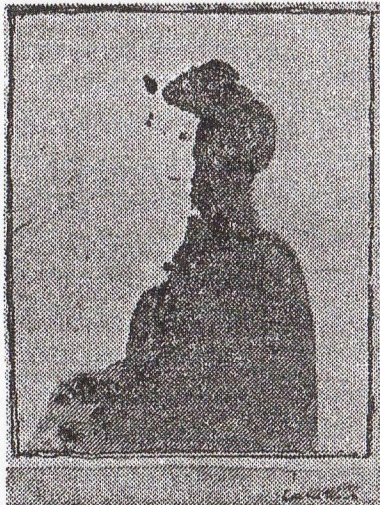
Constants visie op Hannie Schaft, het meisje met het rode haar, dat in de oorlog door de Duitsers is doodgeschoten.

Constant bloeide weer. En de wortels van die nieuwe ontwikkeling bleken te liggen in de Europese traditie en de daarin diep verankerde kunst. De man, die samen met Appel en Cornelle ooit een van de