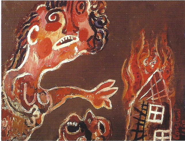
Constant, De Brand, 1950