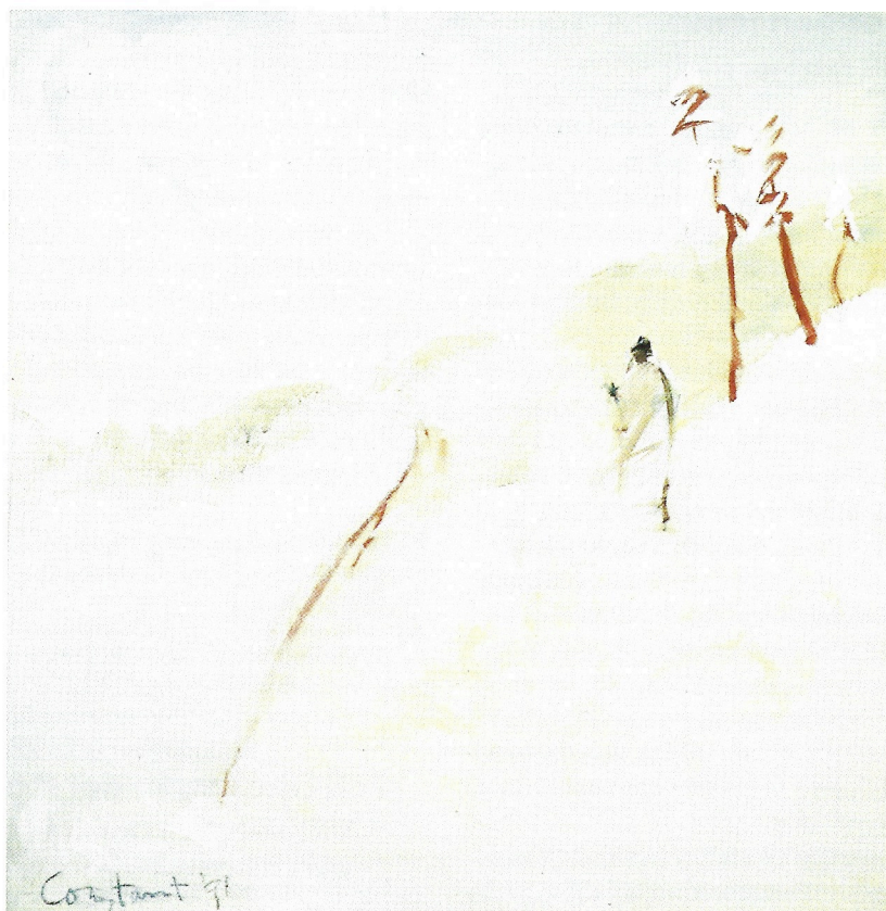
Constant, Winterreise, 1991

Constant lijkt in al die verscheidenheden onverstoort en telkens opnieuw een individualist. Dit neemt niet weg dat het niet altijd even eenvoudig is de eenheid in die verscheidenheid waar te nemen. Anders gezegd: zelfs nu de tentoonstelling zich tot de techniek van het schilderen beperkt, rijst al de vraag of al die schilderijen wel van één en dezelfde hand zijn, in casu van Constant? Het is op het eerste gezicht volstrekt ongeloofwaardig dat de rasechte Cobraschilder die hij was, opeens overgaat tot rechte lijnige composities met vierkanten, om vandaaruit na drie jaren picturaal zwijgen weer te gaan schilderen in een trant die nog het beste als informeel valt te karakteriseren. Na opnieuw gedurende een vijftal jaren nauwelijks te hebben geschilderd tussen 1964 en 1969, markeert Ode à l'Odéon een tot nu toe definitieve bekeerling tot de schilderkunst. Met dit werk dat getuigt de titel zijn oorsprong vindt in de gebeurtenissen van mei 1968 in Parijs, begint een onafgebroken reeks schilderijen die tot op heden aanhoudt. Eerst doen deze sterk denken aan nieuwbabylonische constructies; de invloed van de architectuur met toneelmatige ensceneringen met doorkijken en coulissen is evident. In de loop van het volgende decennium treedt deze architectonische opbouw steeds verder terug ten bate van een toenemend schilderijachtige behandeling van het gehele beeldvlak.