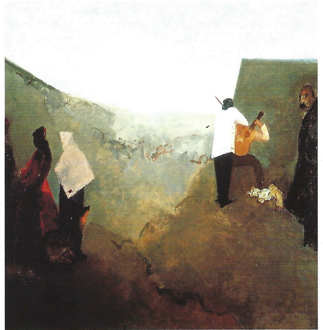
Constant, Nostalgia, 1982