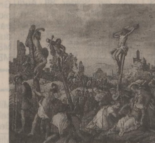
Joachim Beuckelaer, De Kruisiging. 1567. Paneel, 56,5 x 56 cm. Richtprijs Dfl. 120.000-180.000. Veiling 12 november 1996.