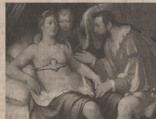
Cornelis van Haarlem, Venus en Mars. 1604. Doek, 100,3 x 132,1 cm. Richtprijs Dfl. 600.000-900.000. Collectie HKH Prinses Christina der Nederlanden. Veiling 19 november 1996.