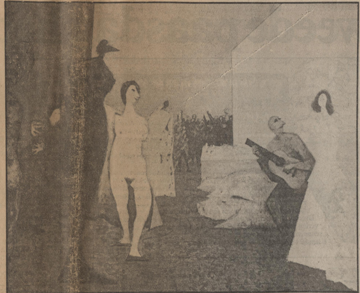
„Bekering van Venus“: gedachten en emoties bij elkaar gezet.

Die zorgvuldigheid komt voort uit de bewuste keuze. Zo is zijn kleurgamma eigenlijk beperkt gehouden en heeft daardoor een stralende kracht, alsof hij uit de voorname aardkleuren licht weet te toveren. Hij vindt op het doek uit, werkt aldus vanuit een aanvangelijke chaos terug naar een figuratie, een vorm, waarin hij zijn werkelijkheid gezuiverd terug geeft. Een andersom-proces met een beleefbare uitslag, waarin hij zich voorstelt als een man van cultuur, verzadigd en gevormd door dichters en schilders van zijn voorkeur, die hij soms in zijn schilderijen bij elkaar zet. Zo ontmoet Christus (man voor peloton?) Venus, beiden tragisch in het schilderij „Bekering van Venus“; in „Plaisir et Tristesse de l'Amour“ komt de wellust aan bod zonder vrolijkheid. Maar de geest maakt levend.