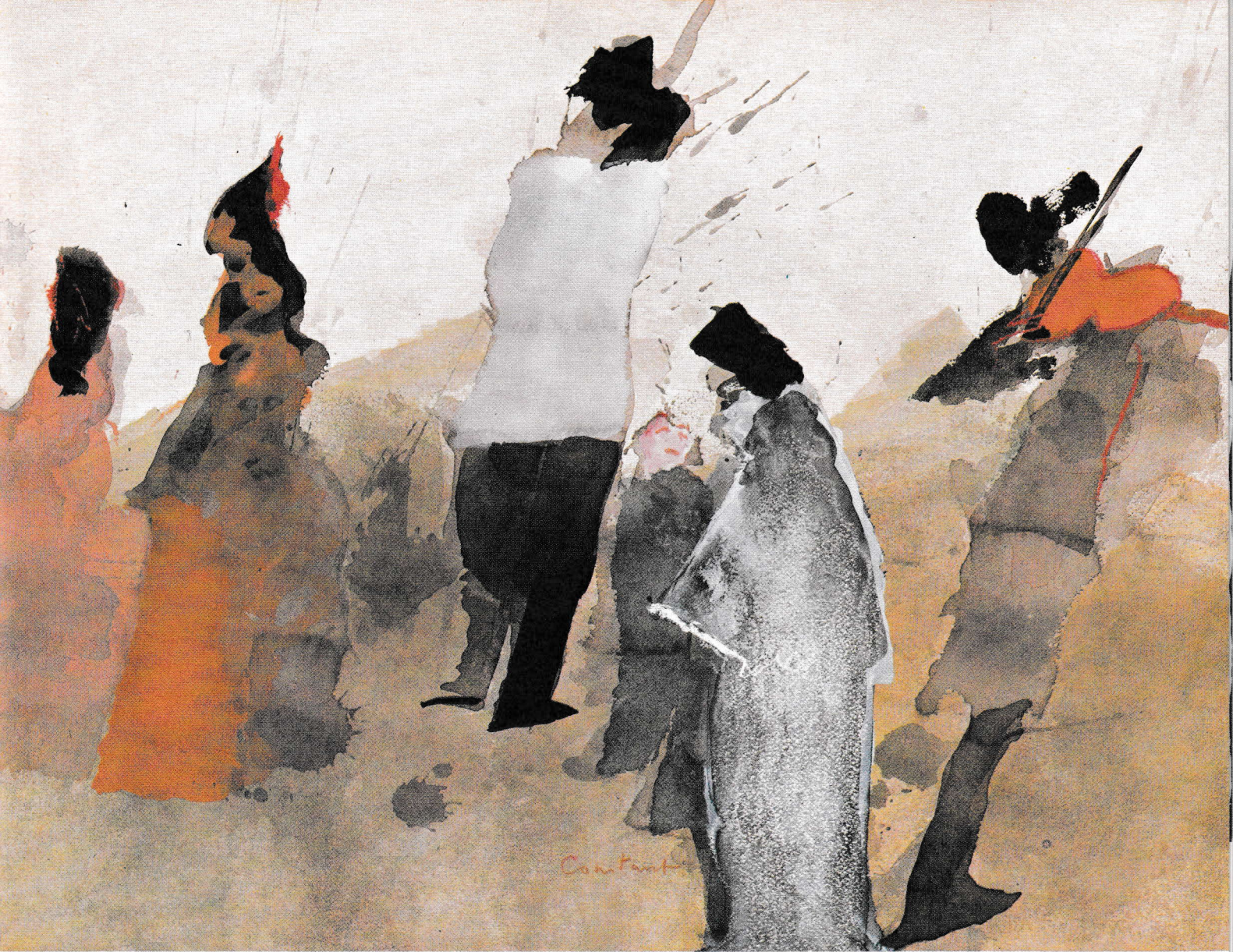
aquarel 43,5 x 59 cm, titel: 'Zigeuners'